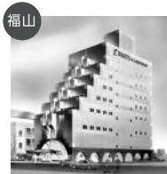
福山 穴吹ビジネス専門学校