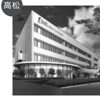
高松 穴吹リハビリテーションカレッジ