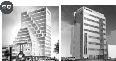
徳島 専門学校 徳島穴吹カレッジ