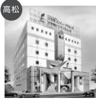
高松 穴吹コンピュータカレッジ 穴吹ビジネスカレッジ