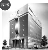
高松 穴吹デザインカレッジ 穴吹ビューティカレッジ