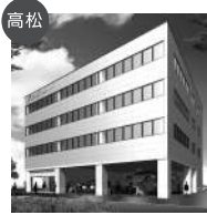
高松 穴吹工科カレッジ