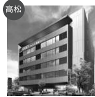
高松 穴吹パティシエ福祉カレッジ