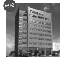
高松 穴吹医療大学校