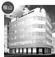
福山 穴吹国際みらい専門学校