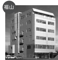
福山 穴吹調理製菓専門学校