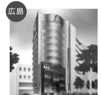
広島 穴吹デザイン専門学校