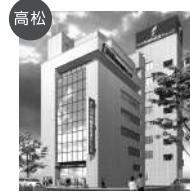
高松 穴吹動物看護カレッジ